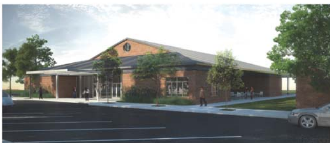
ST. DOMINIC CATHOLIC CHURCH NEW PARISH HALL